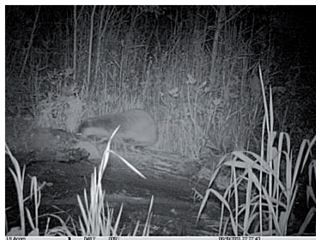
Рис. 3. Снимок, полученный автоматической фотокамерой LTL Acorn 6210 на р. Ольховатка 6 июня 2013 г. Fig. 3. A picture obtained by the camera-trap LTL Acorn 6210 on Olhovatka River June 6. 2013

В южной части о. Сахалина, как и на о. Хоккайдо, прибрежное рыболовство осуществляется интенсивно. Так, в восточной части залива Анива в период хода лососей ставные невода стоят вдоль морского побережья через каждые два километра, но никакого воздействия выдры на горбушу рыбаки